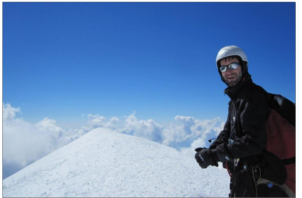
Celui qui a atterri deux fois sur le mont Blanc rêve aujourd'hui de faire de sa passion un métier.

D'une durée de deux fois sept mois, la formation débutera en mars. Son objectif :